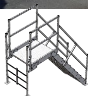
Saut de loup Avec échelle de redescente verticale