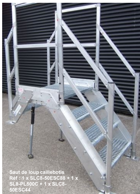
Saut de loup caillebotis Réf : 1 x SLC8-50ESC88 + 1 x SL8-PL500C + 1 x SLC8- 50ESC44