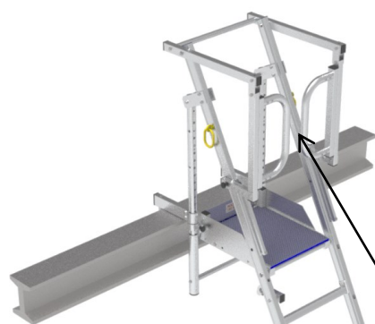
Plate-forme d'accès pliante, permettant le rangement et le transport facile

Portillon saloon pour accès facile à la plate-forme