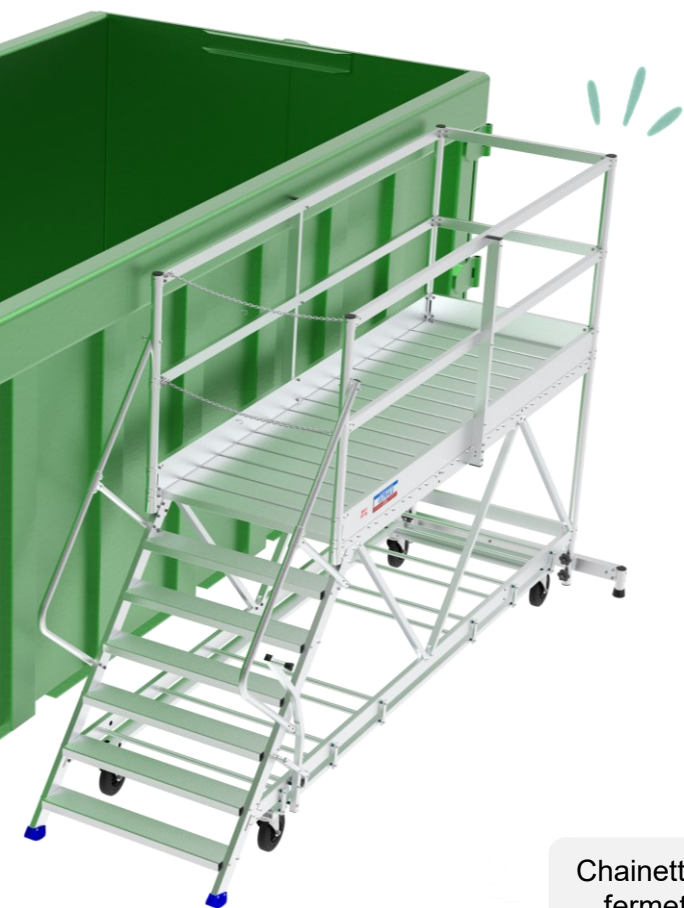
Plate-forme en aluminium pour accès bennes à déchets