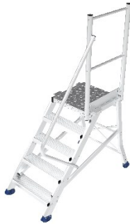
Réf. ES3051 + ES D Estrade 5 marches protection droite