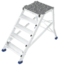
Réf. ES3051 Estrade 5 marches