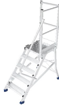
Réf. ES3051 DA Estrade 5 marches protections droite arrière