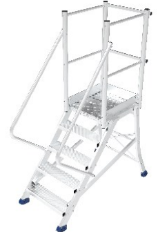
Réf. ES3051 + ES PT Estrade 5 marches protection totale