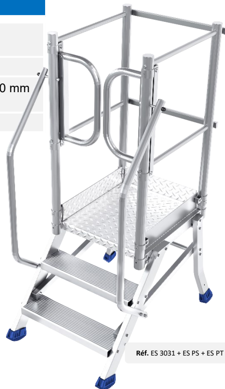
Réf. ES 3031 + ES PS + ES PT