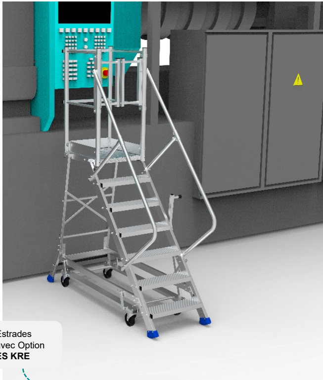
Estrades avec Option ES KRE