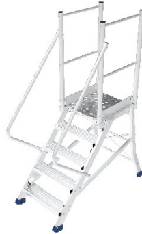
Réf. ES3051 + ES GD Estrade 5 marches protections gauche et droite