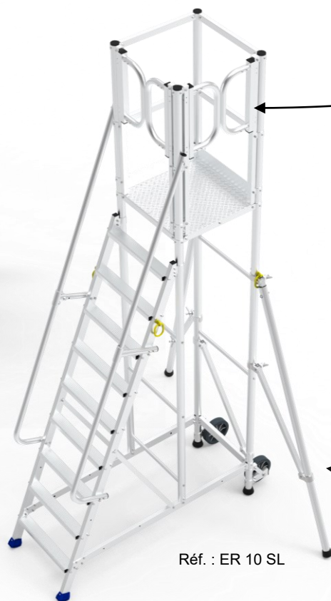
Réf. : ER 10 SL