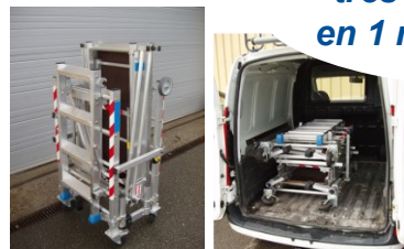
Stockage et transport aisés

“ Le NORMAPLI est un produit MDS (Montage et démontage en sécurité). Grâce à son système de garde-corps intégrés au plateau, le NORMAPLI R ne peut être monté et utilisé qu'en sécurité. ”