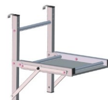
Option porte-outils Réf. NMP PO