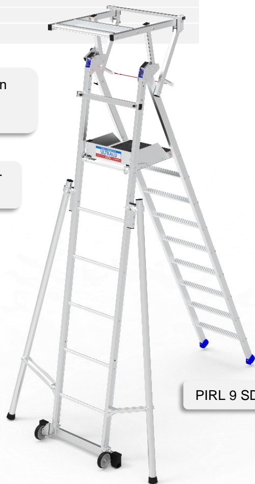
PIRL 9 SD