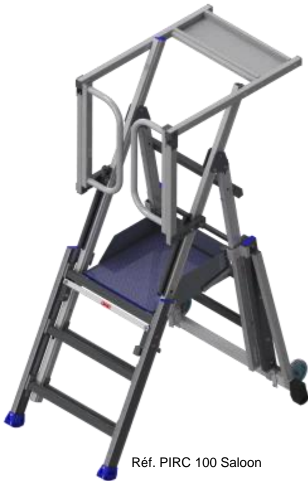
Réf. PIRC 100 Saloon

* Conforme Décret 2004-924 (hors-norme PIRL)