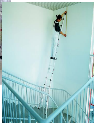
Photo : position en escalier avec pied réglable