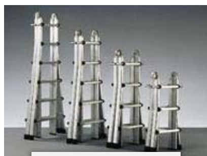
4 Hauteurs au choix