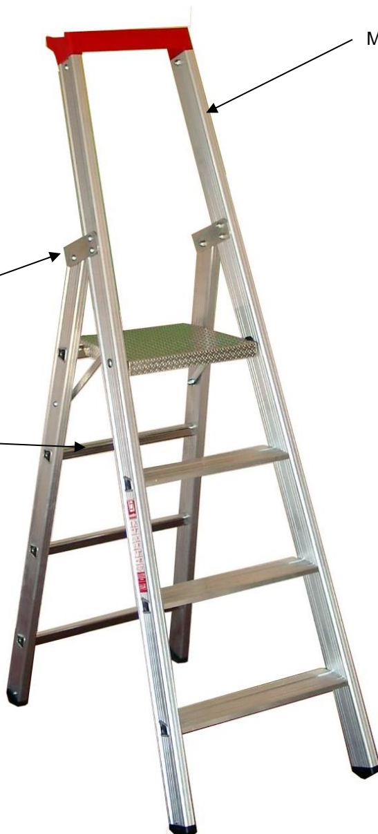
Montants de forte section