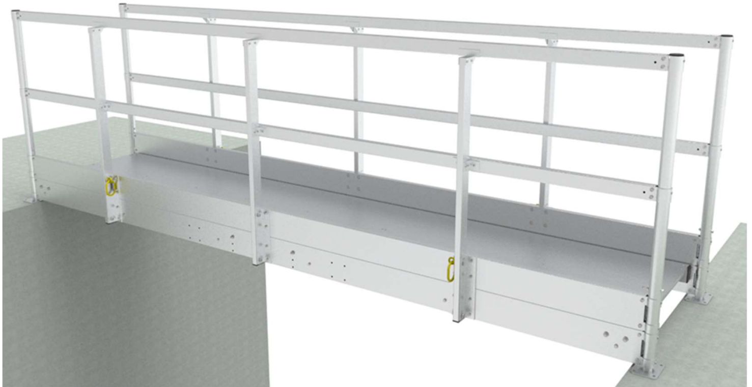
Version année 2021

A envoyer par courriel ultralu@ultralu.com