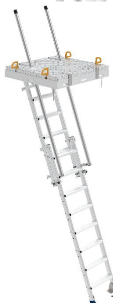
MAD SKYDOME avec trappe Réf. MAD3SKD T 1x1 m