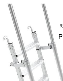
Réf. MAD CROCHET

Platines d'appui à spiter pour décalage du MAD