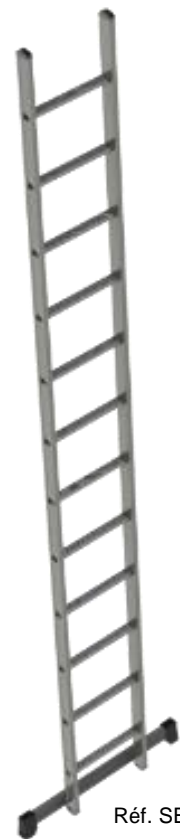
Réf. SE 12