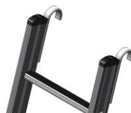
Option crochets Ø 50 mm Réf. 12146007_2PR