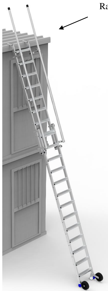
Rampes de sortie escamotable