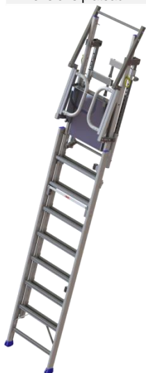
Plate-forme d'accès pliante, permettant le rangement et le transport facile