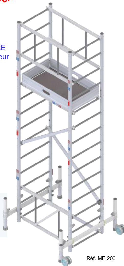
Réf. ME 200

80% du volume reste disponible pour autres outils et consommables.