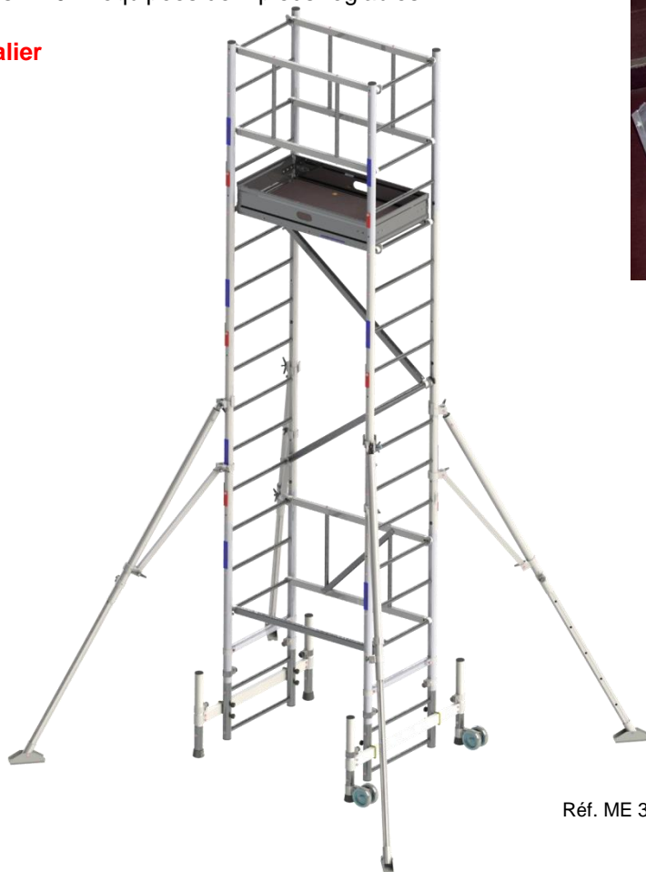
Réf. ME 300

Porte outil référence BPO poids 4,8 kg Dimensions 400 mm x 400 mm